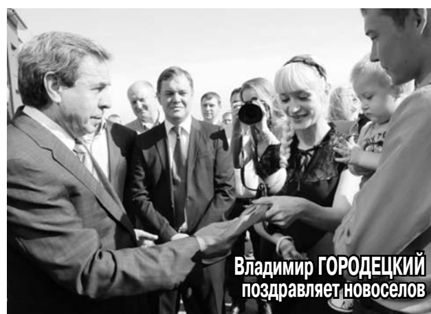
Владимир ГОРОДЕЦКИЙ поздравляет новоселов

Соглашение предусматривает ввод на территории региона дополнительно не менее 145 тысяч квадратных метров жилья экономического класса под ключ до 1 июля 2017 года при стоимости его реализации не более 30 тысяч рублей за квадратный метр, что существенно меньше среднерыночной цены в Новосибирске. Строительным компаниям-участникам программы федеральный бюджет будет компенсировать расходы на строительство инженерных