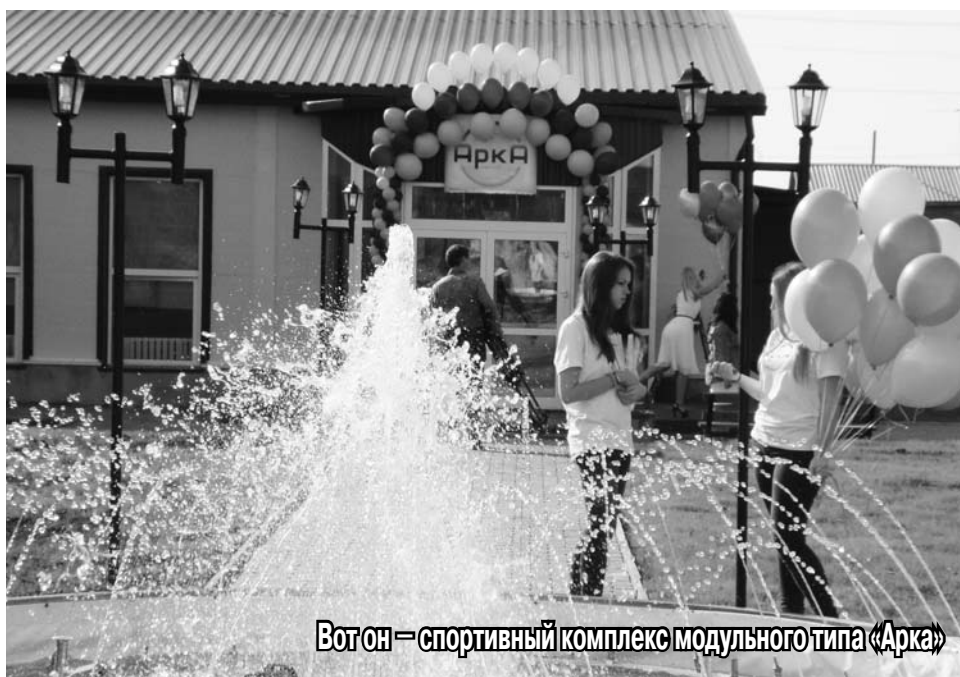
Вот он — спортивный комплекс модульного типа «Арка»