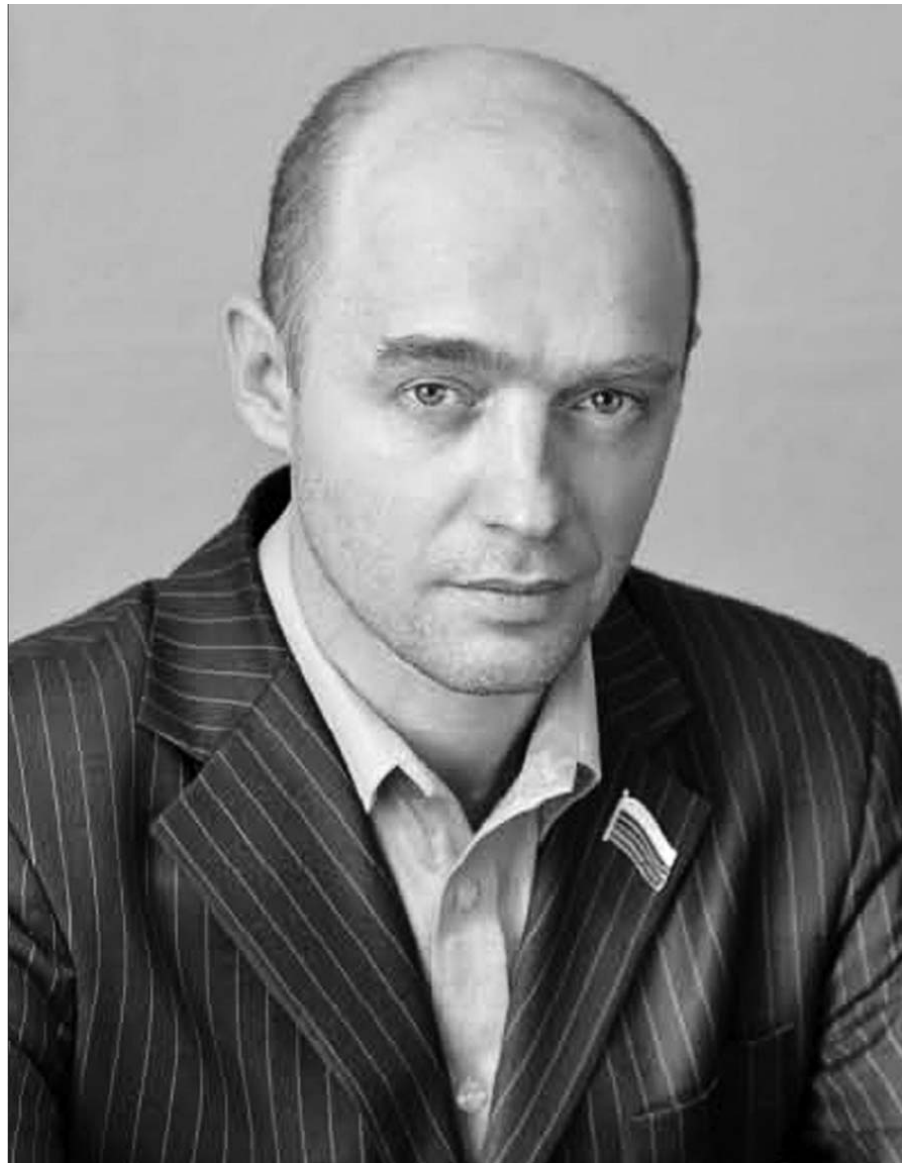
Опубликовано бесплатно в соответствии со статьей 44 Закона Новосибирской области от 28 июня 2012 г. № 243-ОЗ «О выборах Губернатора Новосибирской области» по договору о предоставлении бесплатной печатной площади для проведения предвыборной агитации

Политика — достаточно жесткое ремесло и малопредсказуема... Прогноз — самый уязвимый жанр в политической деятельности... На выборы я пошел, потому что это не только мое личное желание, а решение партии и дружественных нам общественных организаций и движений, которые убеждены, что наша задача — последовательно доносить социалистические идеи до избирателей.