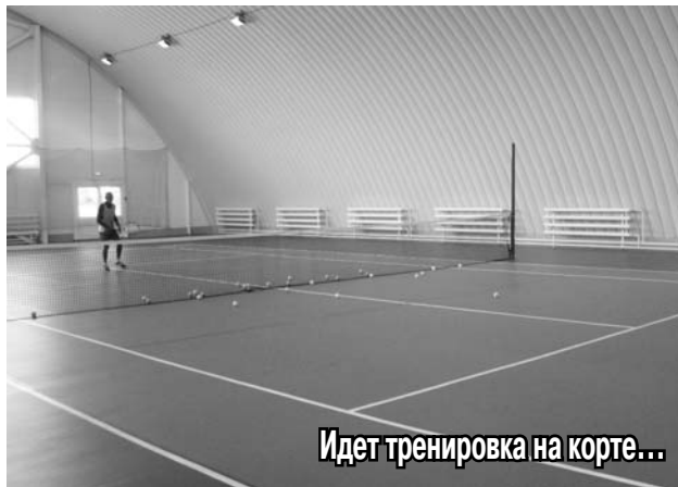
Идет тренировка на корте...

любая вода в бассейне о четырех дорожках. Уже упомянутые мною дети под руководством тренера