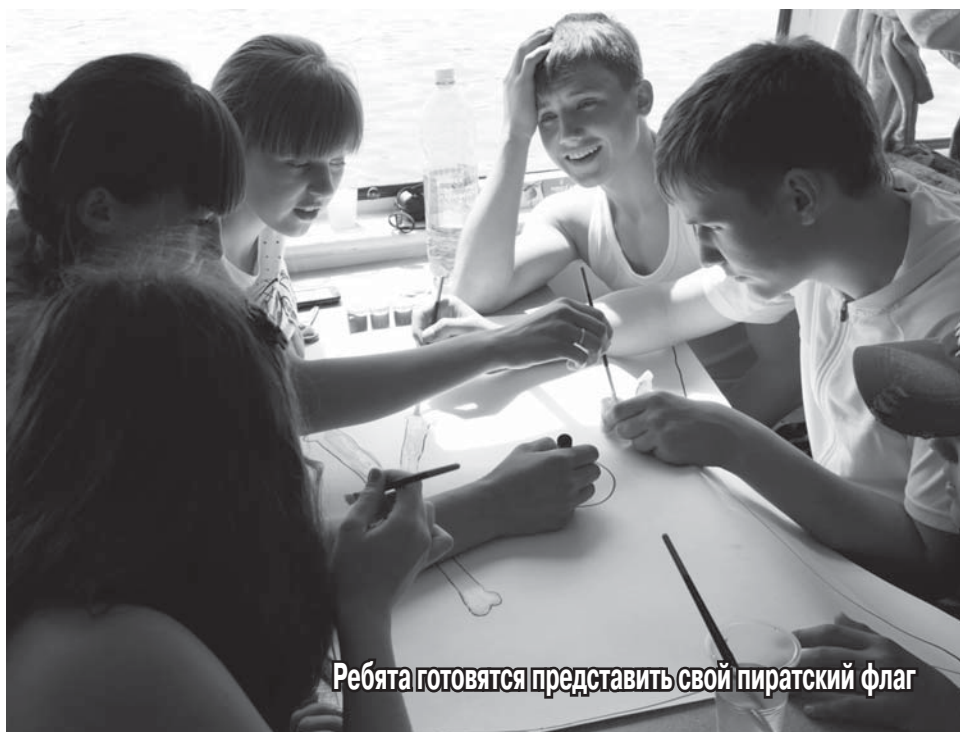
Ребята готовятся представить свой пиратский флаг

Звучит команда капитана: «Отдать швартовы!» – и веселье начинается. Тут же выясняется, что все присутствующие оказались на корабле пиратов, которые предлагают им вступить в их ряды и бороздить моря под пиратским флагом на судне под названием «Белая жемчужина». Заманчивое предложение, от которого никто не смеет отказаться. А пока длится плавание, можно и поиграть. Гостям предлагают разделить на команды и подняться на верхнюю палубу, где можно в полной мере насладиться прекрасной солнечной погодой. Но расслабляться не приходится. Новоявленным пиратам дают задание – придумать название и лозунг для своих команд, с чем они довольно успешно справляются. Далее следует еще несколько конкурсов, но обед – дело святое. Перекусив не совсем пиратской едой, ребята начинают придумывать собственные флаги. А в таком деле главное – начать, а потом фантазию уже трудно удержать. Как оказалось, практически все присутствующие неплохо знакомы с пиратской тематикой и атрибутами. Череп с костями – неотъемлемый элемент почти на всех флагах. Выбрать лучший из них – сложно, но возможно, что и было сделано.