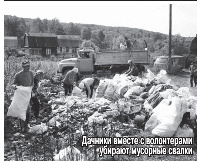
Дачники вместе с волонтерами убирают мусорные свалки

Около десяти назад в общественной организации «Сибирский экологический центр» («МБОО Сибэкоцентр») появилось еще одно направление — Издревское, по защите малых рек.