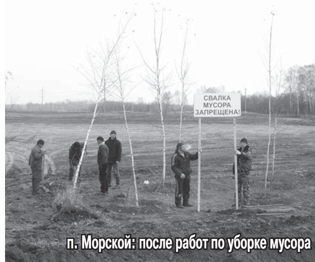
п. Морской: после работ по уборке мусора

организации, которые имеют лицензию на вывоз твердых бытовых отходов, и они готовы сотрудничать с садоводческими товариществами. В большинстве своем они расположены в черте города, поэтому и увеличивают стоимость вывоза. Например, в прошлом году в Новолуговском сельсовете одна машина на 5–6 кубометров мусора стоила 2 100 рублей. Такая же машина в Железнодорожном или в Березовке — около 5 000–6 000 рублей. Есть председатели, которые готовы установить контейнеры для мусора либо заключить договор по кольцевой схеме вывоза мусора, то есть чтобы жители выставляли мешки с мусором возле своих калиток, а машина проезжала и собирала их. На самом деле,