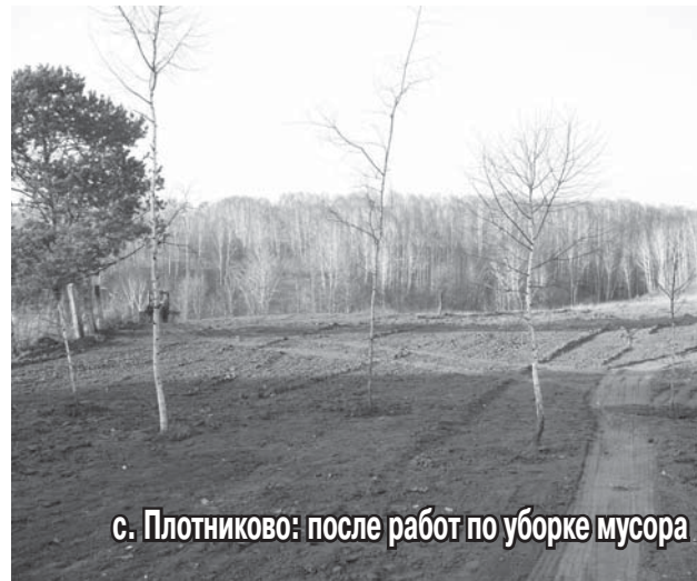
с. Плотниково: после работ по уборке мусора

Примечание: подробнее познакомиться с деятельностью Сибэкоцентра и его «Издревской» программы вы можете на сайтах: http://izdrevaya.ru и http://sibecocenter.ru .