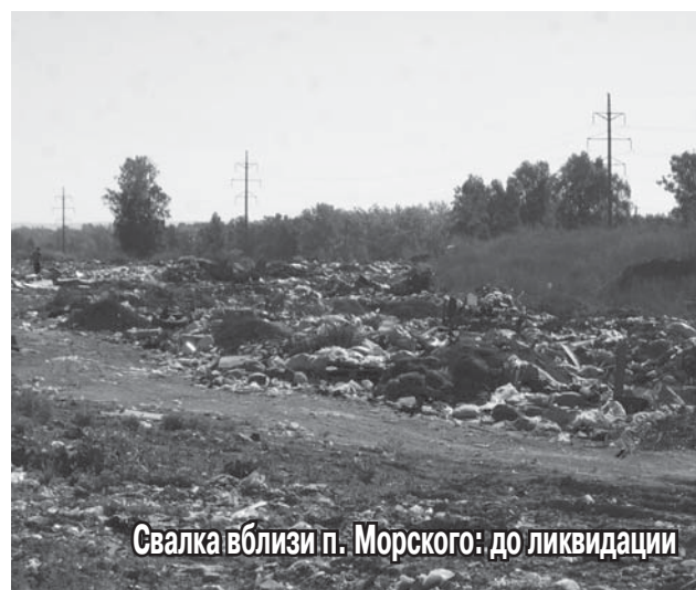
Свалка вблизи п. Морского: до ликвидации

— На территории Плотниковского сельсовета было убрано две свалки. На одной из них даже было установлено видеонаблюдение, да и члены садоводческих товариществ сами следят, чтобы не мусорили. На другой свалке поставили контейнер, который