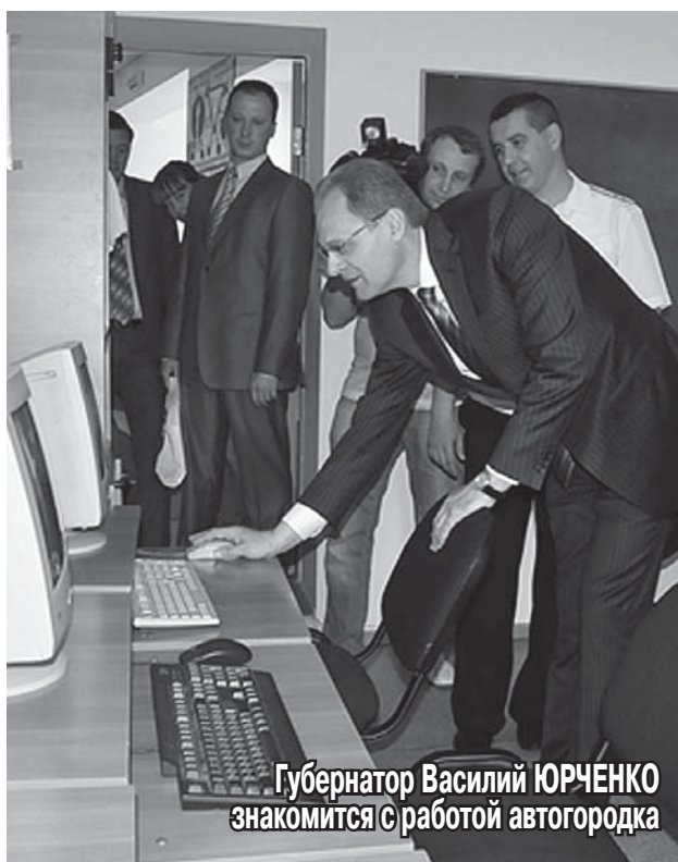
Губернатор Василий ЮРЧЕНКО знакомится с работой автогородка

Глава области 1 июня побывал в детском автогородке.