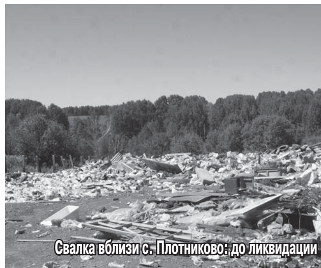
Свалка вблизи с. Плотниково: до ликвидации

Садоводы, кстати, тому яркий пример. Они не мусорят у